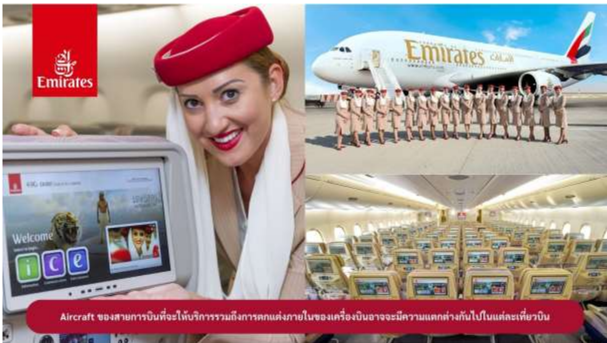
Aircraft ของสายการบินที่จะให้บริการรวมถึงการตกแต่งภายในของเครื่องบินอาจมีความแตกต่างกันไปในแต่ละเที่ยวบิน

21.35 น. ✈️ ออกเดินทางสู่ เมืองดูไบ ประเทศสหรัฐอาหรับเอมิเรตส์ โดยสายการบินเอมิเรตส์ เที่ยวบินที่ EK373 (🍽️ บริการอาหารและเครื่องดื่มบนเครื่องบิน)