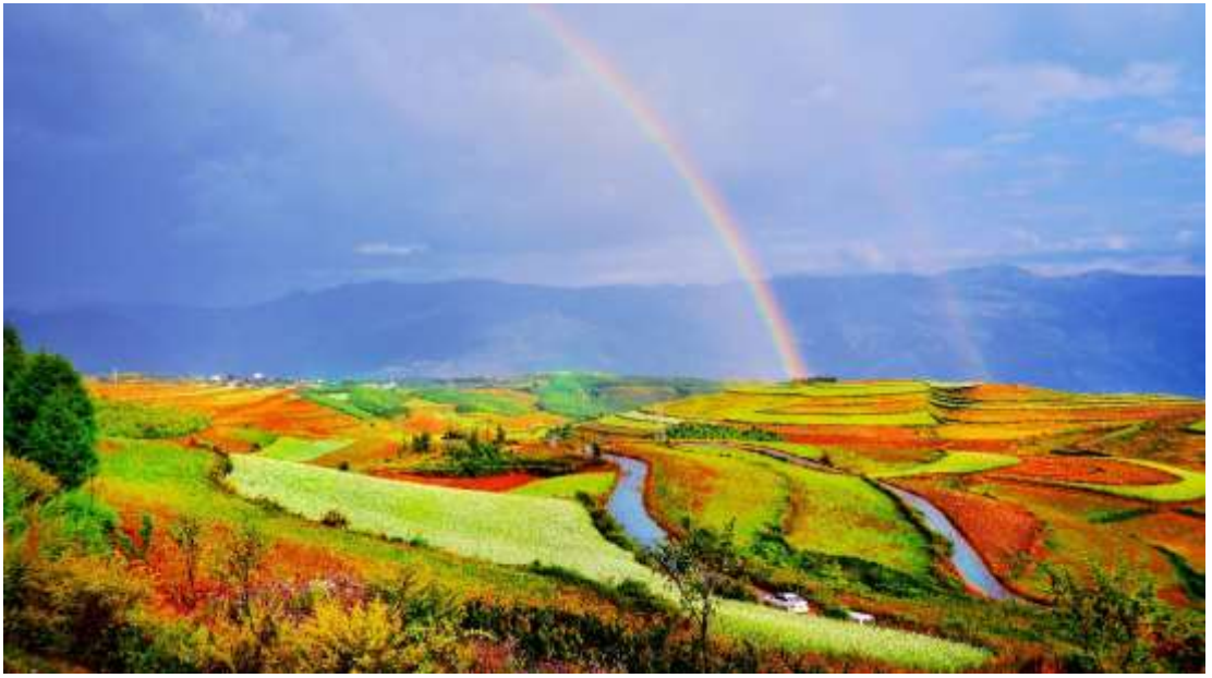
อีกแห่งของประเทศ

ภาพความประทับใจของภูเขาบริเวณนี้มีชาติหลัก และแร่ธาตุอื่นๆที่อุดมสมบูรณ์ เมื่อเจอออกซิเจนได้ เกิดปฏิกิริยาออกซิเดชันกลายเป็นสีแดง เมื่อกระทบกับแสงแดดเป็นภาพที่งดงามมากๆ ดงชนยังเป็น ดินแดนบริสุทธิ์ที่รู้จักกันในหมู่นักถ่ายรูปจีนและชาวต่างชาติต่างยกย่องให้เป็นจุดที่มีภูมิทัศน์สวยงามที่สุด