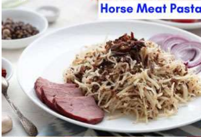
Horse Meat Pasta