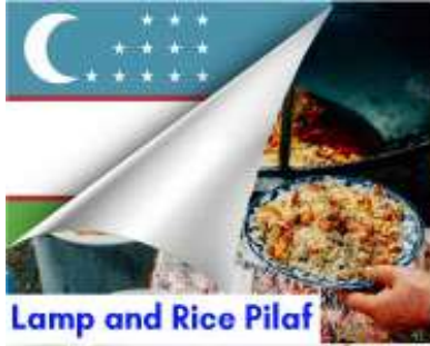
Lamp and Rice Pilaf