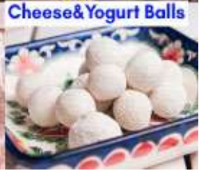
Cheese & Yogurt Balls