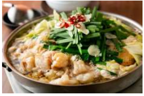
ร้านอาหารย่านยะไต (YATAI)

เย็น อิสระรับประทานอาหารค่ำตามอัธยาศัย เพื่อให้ท่านได้ช้อปปิ้งอย่างเต็มที่ (มีไกด์แนะนำ) พักค้างคืน ณ โรงแรม NISHITETSU GRAND HOTEL (★★★★) หรือเทียบเท่า