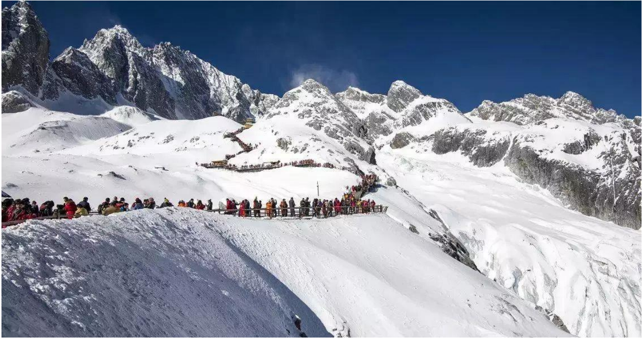
ชมการแสดง IMPRESSION LIJIANG โชว์อันยิ่งใหญ่โดยผู้กำกับชื่อก้องโลก “จาง อวี๋โหมว” ได้เนรมิตให้ภูเขาหิมะมังกรหยกเป็นฉากหลัง และบริเวณทุ่งหญ้าเป็นเวทีการแสดง โดยใช้นักแสดงกว่า 600 ชีวิต แสง สี เสียง การแต่งกายตระการตา เล่าเรื่องราวชีวิตความเป็นอยู่ และชาวเผ่าต่างๆของเมืองลี่เจียง