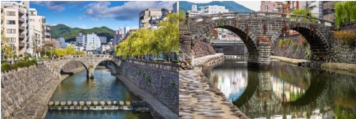
สะพานเมกานะบาชิ (Meganebashi Bridge)

นากาซากิ (Nagasaki) เป็นเมืองที่ตั้งอยู่ทางตะวันตกของเกาะคิวชู ประเทศญี่ปุ่น เมืองนี้เป็นที่รู้จักจากประวัติศาสตร์อันยาวนานและวัฒนธรรมที่หลากหลาย เมืองนี้เป็นที่รู้จักจากชายหาดที่สวยงาม อาหารทะเลสด และสถานที่ท่องเที่ยวทางประวัติศาสตร์และวัฒนธรรมมากมาย