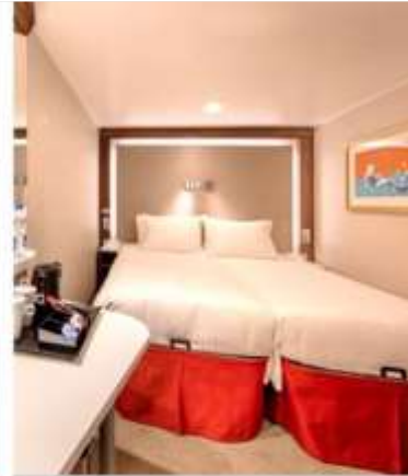
Interior Stateroom 402 Staterooms from 13 sq.m – 14 sq.m