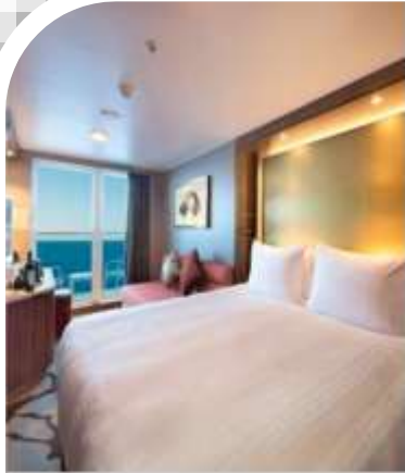
Oceanview Stateroom with Balcony 1,046 Staterooms from 20 sq.m – 28 sq.m