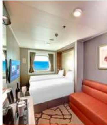
Oceanview Stateroom with Window 84 Staterooms from 16 sq.m – 35 sq.m