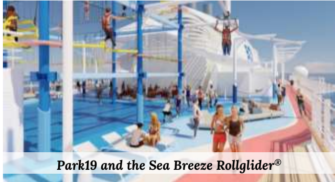
Park19 and the Sea Breeze Rollglider®

วันนี้ เรือสำราญ ชั้นปรีนเซส จะล่องไปตามสายน้ำในทะเลเมดิเตอร์เรเนียน ที่มีอากาศบริสุทธิ์ สดชื่นขอเชิญพักผ่อนตามอัธยาศัย สนุกสนานเพลิดเพลินกับกิจกรรมต่าง ๆ มากมายบนเรือ