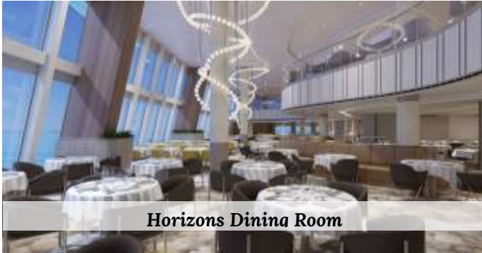
Horizons Dining Room