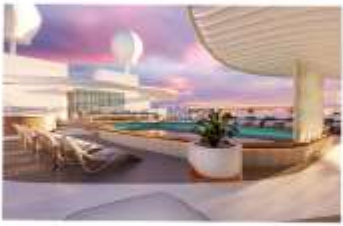
Signature Sun Deck

Introducing the Signature Collection, exclusively on Sun Princess®. In addition to premium stateroom amenities, Signature Collection Suites include access to the Signature Restaurant, Signature Lounge and private Signature Sun Deck, a private area of the Sanctuary.