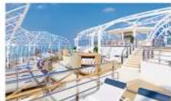
Sea View Terrace