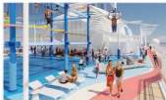
Sea Breeze Rollglider® and The Net Ropes Course