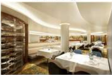
Reserve Collection Restaurant