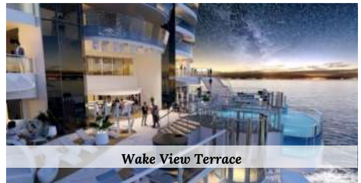
Wake View Terrace