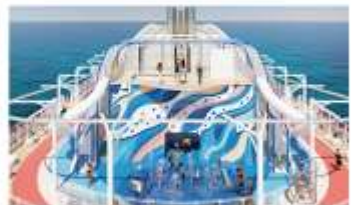
Coastal Climb, Splash Pad & The Lookout