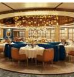
Sabatini's Italian Trattoria