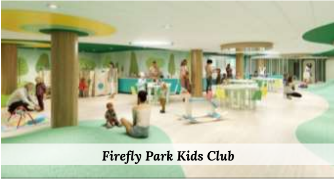
Firefly Park Kids Club