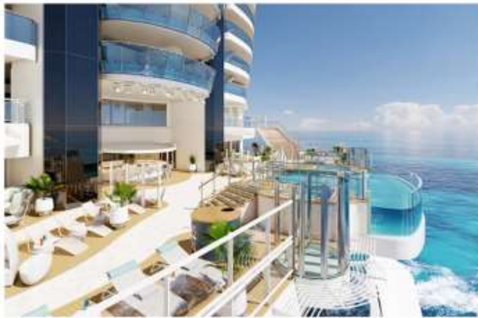
Wake View Terrace