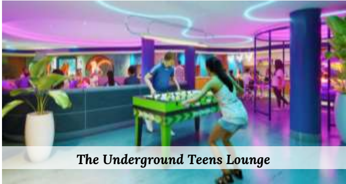
The Underground Teens Lounge

17.45 น. รับประทานอาหารค่ำที่ห้องอาหารใหญ่บนเรือ พักค้างคืนบนเรือสำราญ SUN PRINCESS