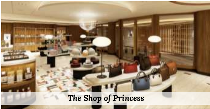
The Shop of Princess