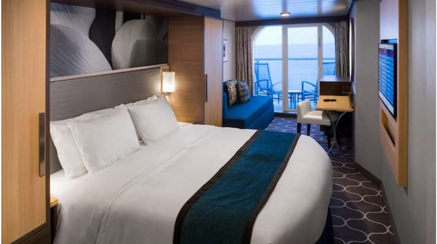
ห้องมีระเบียงส่วนตัว วิวทะเล Balcony ขนาดห้องเริ่มต้น 198 ตารางฟุต

สนใจห้องพักรบนเรือประเภทอื่น ๆ นอกเหนือจากที่ระบุ โปรดสอบถามค่าบริการเพิ่มเติมจากเจ้าหน้าที่