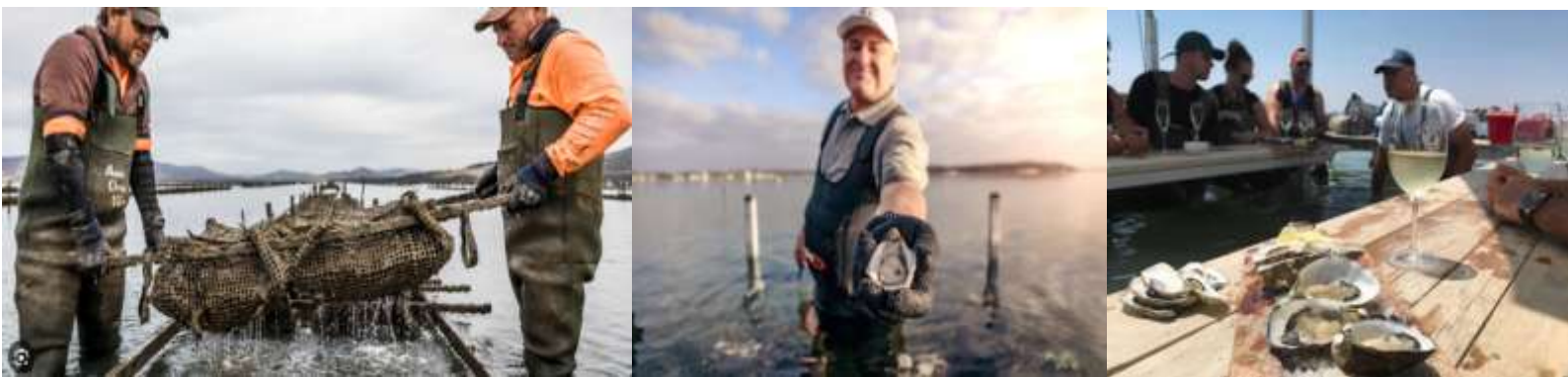
เที่ยง รับประทานอาหารกลางวัน อาหารท้องถิ่น ณ กิจตาดาร Barilla Bay

06.25 น. เดินทางถึง นครซิดนีย์ ประเทศออสเตรเลีย หลังผ่านตรวจคนเข้าเมือง นำท่านเดินทางสู่อาคารภายในประเทศ 09.25 น. ออกเดินทางสู่ เมืองโฮบาร์ท โดยสายการบินแควนตัส เที่ยวบินที่ QF993 11.20 น. เดินทางถึง นครโฮบาร์ท เมืองหลวงรัฐแทสมาเนีย เมืองหลวงแห่ง รัฐแทสมาเนีย เป็นเมืองลำดับที่ 2 ที่มีการสร้างเมืองในประเทศออสเตรเลีย ในปี พ.ศ. 2346 (ค.ศ.1803) เป็นเกาะที่ตั้งอยู่ทางใต้สุดของประเทศออสเตรเลีย และใกล้กับขั้วโลกใต้มากที่สุด อยู่ห่างจากรัฐวิกตอเรีย 240 กิโลเมตร มีประชากรอาศัยอยู่ในเมืองโฮบาร์ท ราวสองแสนคน ในขณะที่ทั้งรัฐแทสมาเนียมีประชากรอาศัยอยู่ราวห้าแสนคน ภูมิประเทศล้อมรอบด้วยมหาสมุทร แม่น้ำ และภูเขาสูงตระหง่าน จึงทำให้มีทิวทัศน์ที่สวยงามแห่งหนึ่งของโลกโดยมีอนุภูมิภาคเฉลี่ยในฤดูร้อนอยู่ที่ 11 - 21 องศาเซลเซียส และ 4 - 11 องศาเซลเซียส ในฤดูหนาว นำท่านชม ฟาร์มหอยนางรม (Barilla Bay Oyster)