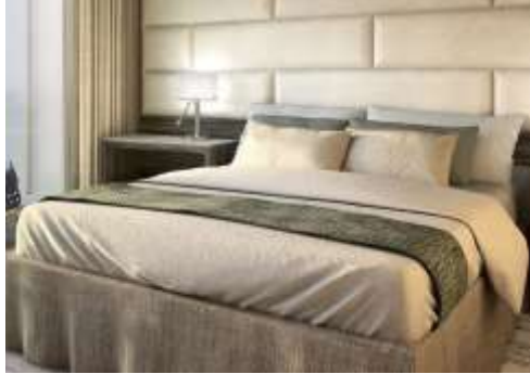
CLASSIC VERANDA SUITE

*กรุณาตรวจสอบเงื่อนไขการจองทุกครั้งก่อนทำการจอง*