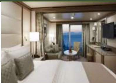
Classic Veranda Suite