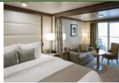
Superior Veranda Suite