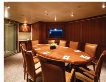
Card Room/conference Room

Enjoy a selection of games at the Silversea Casino for guests 18 and older, or discover new games during your luxury cruise.