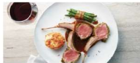
The Haven Restaurant

Savor an exclusive array of dishes for breakfast, lunch and dinner in a private restaurant serving the finest cuisine. Enjoy stunning vistas indoors or al fresco. Exclusively for guests of The Haven. Seating capacity: 98