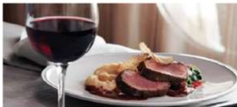
The Manhattan Room

One of three Main Dining Rooms, The Manhattan Room is where guests can enjoy specially curated modern and classic dishes made with the freshest ingredients. Seating capacity: 560