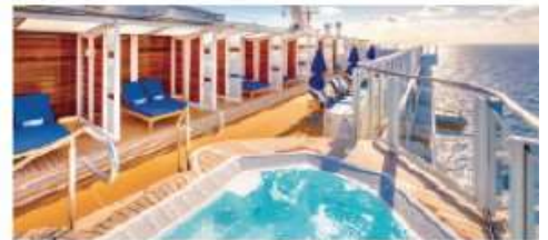
Vibe Beach Club

An adults-only private retreat with stunning views, oversized hot tub and full-service bar. Seating capacity: 60