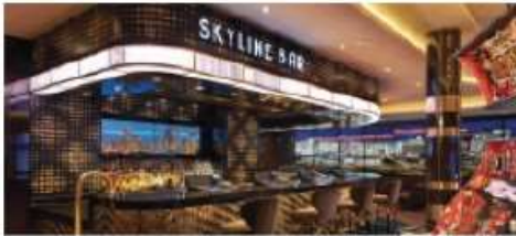
The Skyline Bar

Found inside our award-winning casino, this is the perfect spot to have a cocktail before dinner, meet friends after the show or just press your luck with bar-top poker screens. Seating capacity: 18