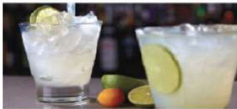
The A-List Bar

The perfect spot to sip a handcrafted cocktail and enjoy the performances from inside The Manhattan Room. Seating capacity: 20