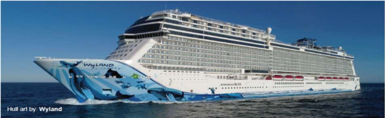
Hull art by: Wyland

Built: 2018 • Gross Tonnage: 168,028 • Guests (Double Occupancy): 4,004 • Overall Length: 1,094ft • Max Beam: 136ft • Crew: 1,716