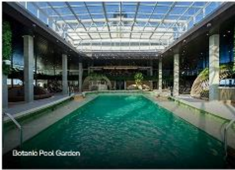
Botanik Pool Garden