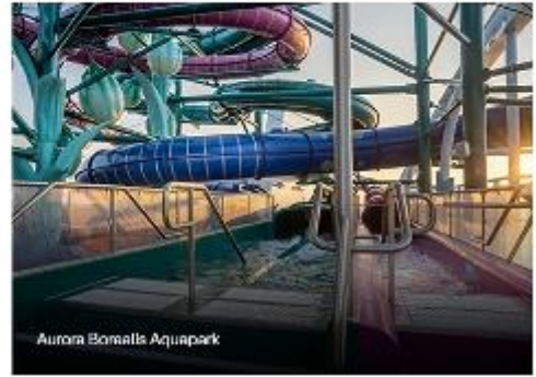
Aurora Borealis Aquapark