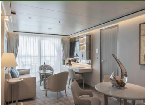
Junior Grand Suite