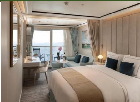
Deluxe Veranda Suite