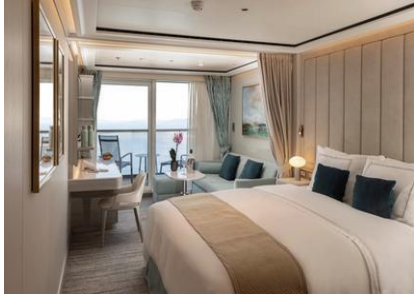
Classic Veranda Suite

*กรุณาตรวจสอบเงื่อนไขการจองทุกครั้งก่อนทำการจอง*