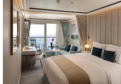
Superior Veranda Suite