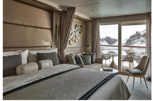
Superior Veranda Suite