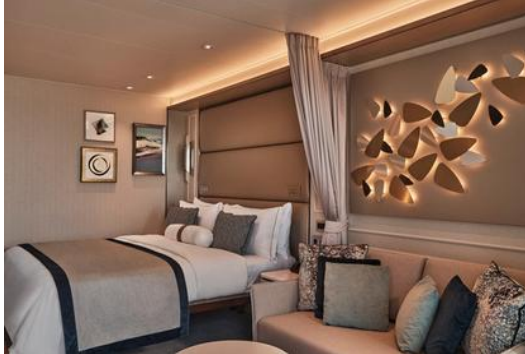
Deluxe Veranda Suite