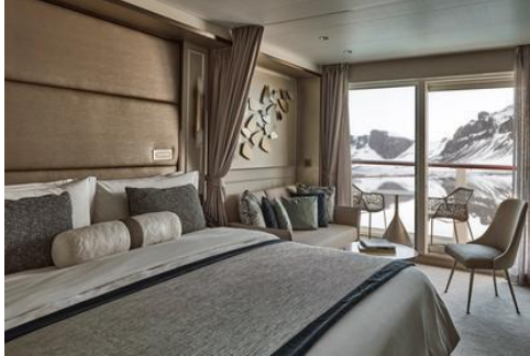
Classic Veranda Suite

*กรุณาตรวจสอบเงื่อนไขการจองทุกครั้งก่อนทำการจอง*