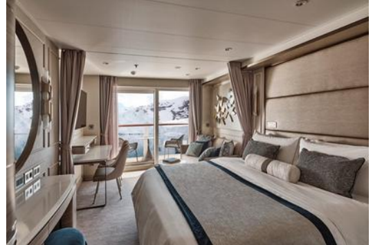
Premium Veranda Suite