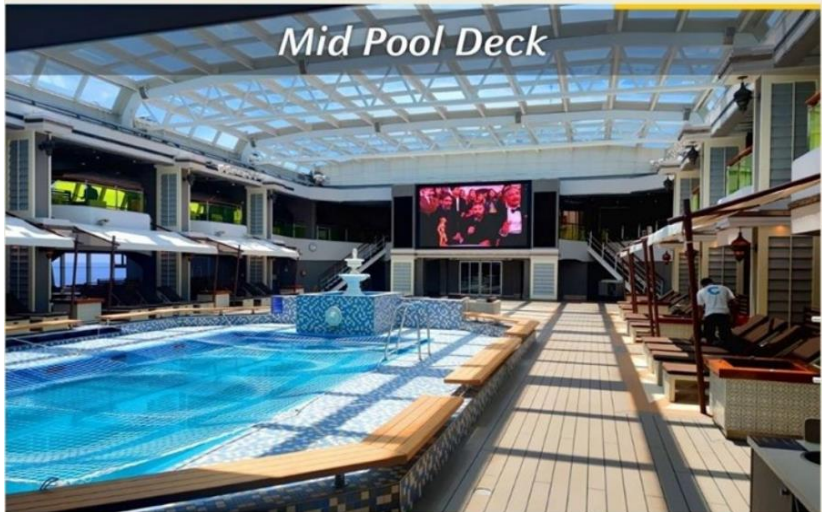
Mid Pool Deck