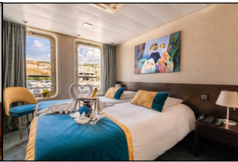
ห้องมีหน้าต่าง panoramic view