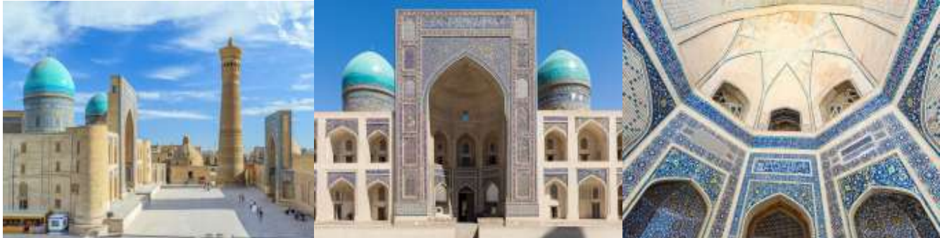
ชมบริเวณด้านนอก โรงเรียนสอนศาสนา มิริ อหรับ (Miri Arab Madrasah) เอเมียร์ อาลิหม ข่าน ที่ถูกสร้างอยู่ในบริเวณเดียวกันกับสุเหร่าคัลยาน ชื่อสถานที่แห่งนี้ได้ถูกตั้งตามชื่อของครู ที่มาสอน มิริ อหรับ ซึ่งมีความหมายว่า เจ้าแห่งอาหรับ