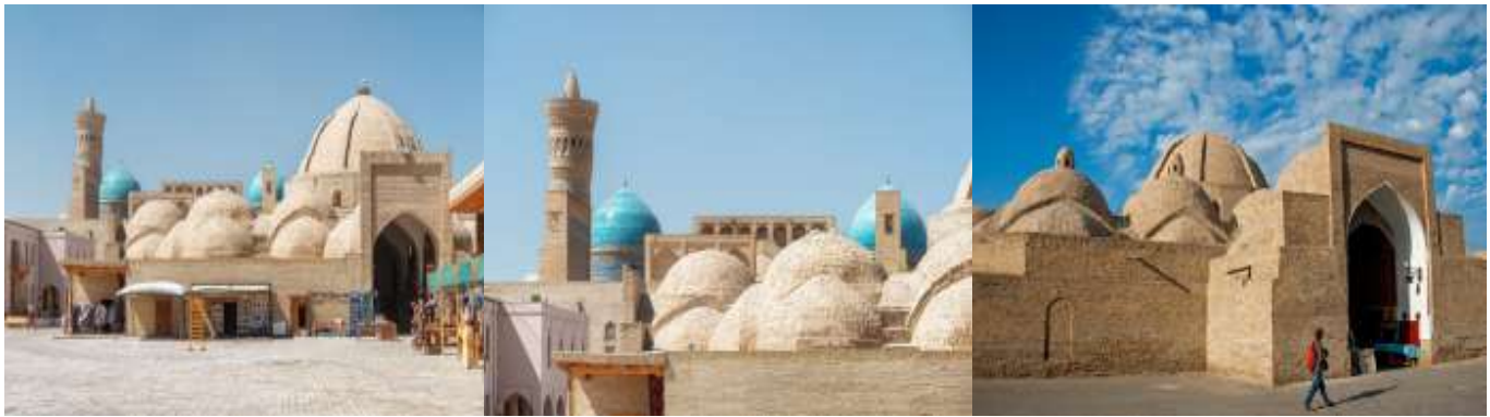
ชม หอโพลี คัลยาน (Poli Kalyan Ensemble and Minaret) รูปร่างของหอนี้ส่วนที่สูงที่สุด เป็นทรงกลม หอนี้ได้ถูกออกแบบเพื่อใช้ในการเรียกประชุมชาวมุสลิม เพื่อมาทำละหมาด