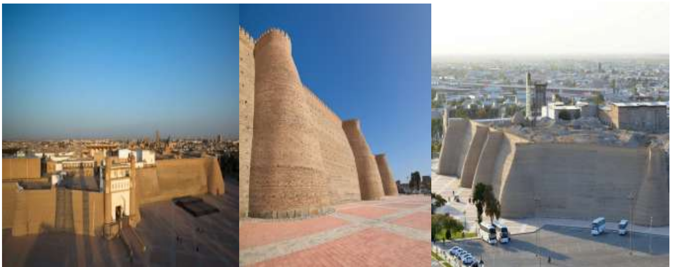
เข้าชม ป้อมดิอาร์ค (The Ark Fortress) เป็นป้อมเก่าแก่ตั้งอยู่ใจกลางเมือง และเมื่อขึ้นไป ด้านบนของป้อม จะสามารถเห็นวิวทิวทัศน์ของเมืองได้อย่างชัดเจน