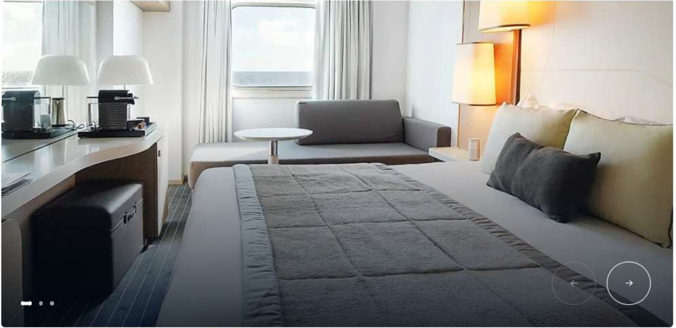
Staterooms and suites