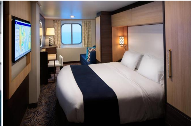
ห้องพักมีหน้าต่าง Ocean View