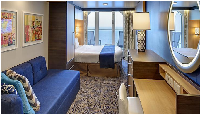
ห้องพักมีระเบียง Balcony