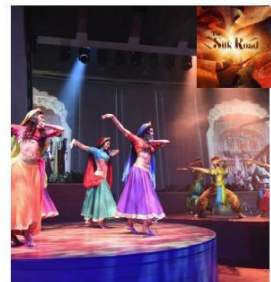
THE SILK ROAD

Touching on the cultures, colors, music, and dance styles of China, Persia, India and Rome, the entertainment extravaganza that is The Silk Road™, will deliver a unique and completely original experience to our guests.