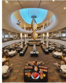
MAIN DINING ROOM