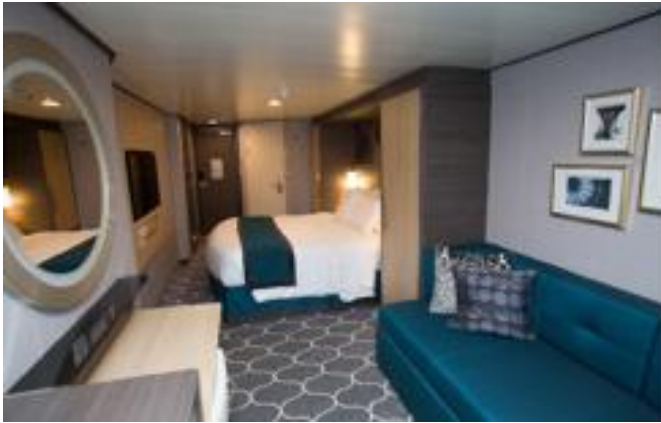
ห้องพักไม่มีหน้าต่าง Interior