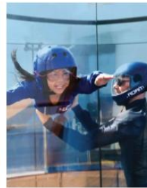
RIPCORD BY IFLY