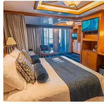
The Palace An exclusive ship-within-a-ship boutique hotel enclaved with private facilities and a 24-hour butler service for connoisseurs of true luxury.