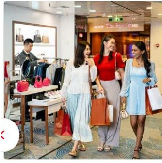
Dream Boutiques Splurge on international luxury brands at our boutiques and take your pick from some of the biggest names in fashion!

..... อิสระเดินทางเอง (ไม่รวมตัวเครื่องบินไป-กลับ) 10.00 น. เช็ก-อิน ณ ท่าเรือ Singapore Cruise Centre (Harbourfront cruise center) วันแรก ควรถึงท่าเรือก่อนเวลาเช็คอิน ไม่น้อยกว่า 3 ชม. ก่อนเวลาเรือออกจากท่าเรือ *** LAST BOARDING / GATE CLOSE TIME IS 22:00 น. *** จากนั้นนำทุกท่านเช็คอินขึ้นเรือสำราญ STAR VOYAGER CRUISE เป็นเรือสำราญลำใหม่ล่าสุดจากสาย การเดินเรือ Star Dream Cruises ซึ่งจะเริ่มให้บริการตั้งแต่วันที่ 26 มีนาคม 2025 เป็นต้นไป โดยมี ท่าเรือหลักอยู่ที่สิงคโปร์ และจะมีการเดินทางไปยังจุดหมายปลายทางยอดนิยมในเอเชียตะวันออกเฉียงใต้ เช่น จาการ์ตา เมดาน มะละกา ปูเลาเรดัง กรุงเทพฯ เกาะสมุย และโฮจิมินห์ซิตี้ 14.00 น. เรือสำราญ STAR VOYAGER ออกจากท่าเรือ Singapore Cruise Centre (Harbourfront cruise center) จากนั้นอิสระพักผ่อนบนเรือตามอัธยาศัย ***Casino จะเริ่มให้บริการหลังเรือล่องออกไปกลางทะเล *** คาสิโน บนเรือสำราญ ให้บริการหลังจากเรือออกเดินทาง และจะหยุดให้บริการเมื่อเรือจอด **ไฮไลต์บนเรือ** อาหาร & ร้านอาหาร: รวมอาหารหลากหลายจาก The Lido, Sophia, North Star ความบันเทิง: โรงละคร Zodiac Theatre, Velvet Lounge, The Playbook และกิจกรรมสนุกๆ บนเรือ โชนสำหรับครอบครัว: Kids Water Park, Rock Wall และกิจกรรมสำหรับเด็ก สุขภาพ & ผ่อนคลาย: Symphony Spa & Wellness, Symphony Fitness, Symphony Salon กีฬา & กิจกรรม: Adventure Park (Rock Wall, Walk the Plank, Zipline), Lawn Bowls, Shuffleboard**