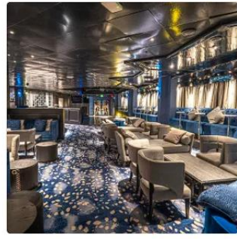
Velvet Lounge Indulge in signature cocktails, premium wines, and spirits in a cozy, stylish setting. Enjoy live entertainment and stunning ocean views as you unwind onboard.