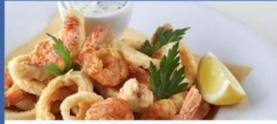
Deck 6 Le Cerisier