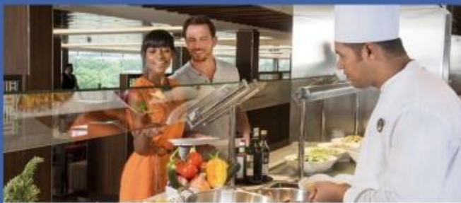
Deck 15 Marketplace Buffet