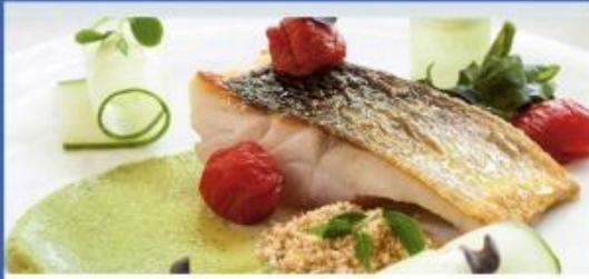
Deck 6 il Ciliegio

ห้องอาหารหลัก บริการอาหารมือค้ำ แบ่งเป็น 2 รอบ อาหารจะเป็นเมดิเตอร์เรเนียน และอาหารนานาชาติ **น้ำดื่มจะมีบริการในห้องบุฟเฟต์เท่านั้น**