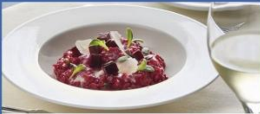
Deck 6 Lighthouse Restaurant