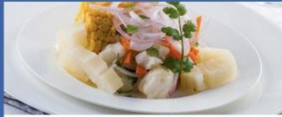
Deck 5 Posidonia Restaurant