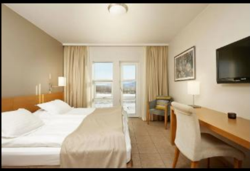
***รูปภาพเพื่อประกอบการโฆษณาเท่านั้น***