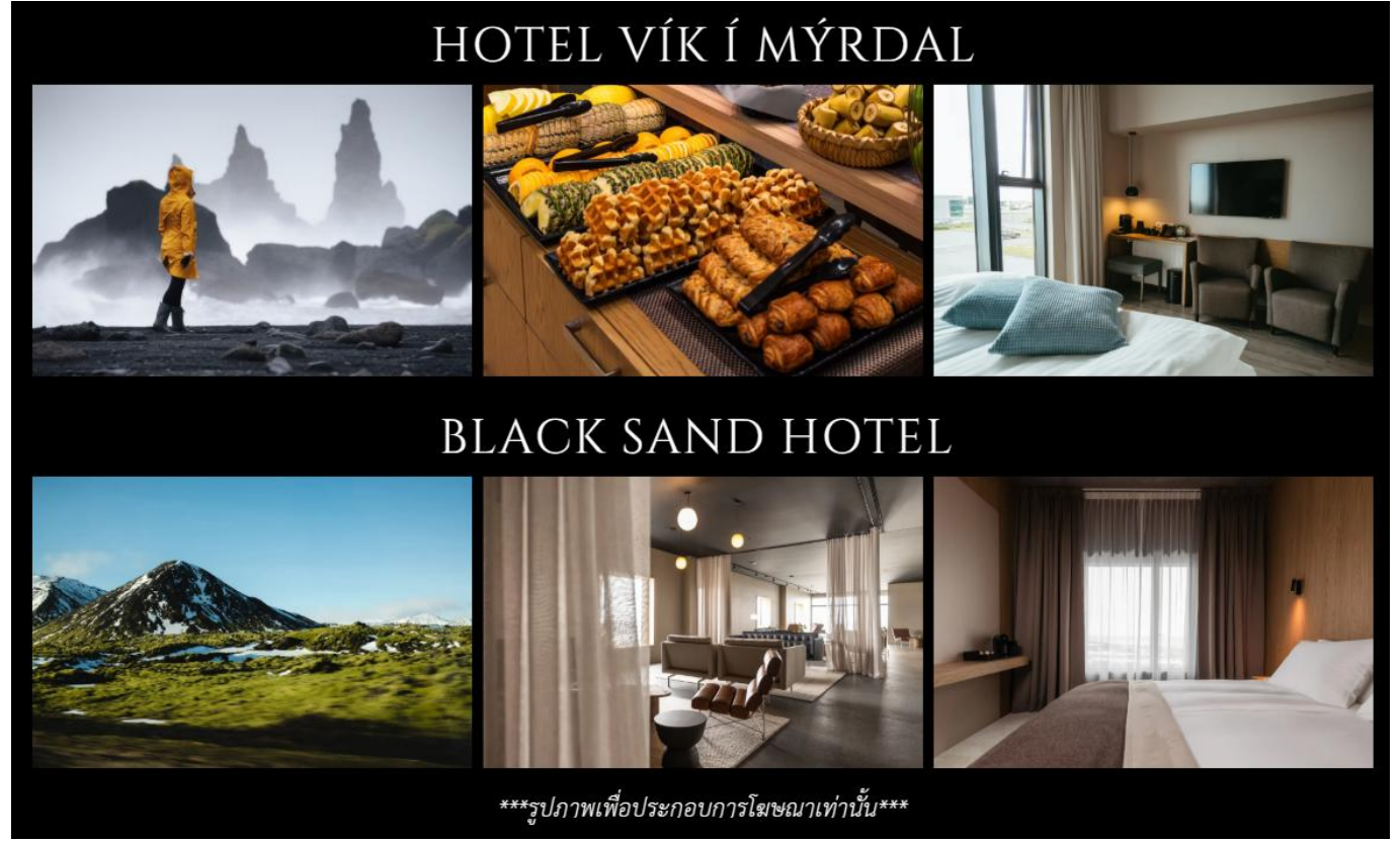
***รูปภาพเพื่อประกอบการโฆษณาเท่านั้น***

นำคณะพัก Hotel Vík í Mýrdal หรือ Black Sand Hotel หรือเทียบเท่าในระดับเดียวกัน ค่าคืนนี้ นำท่านสามารถล่าแสงเหนือได้จากที่พักโรงแรม NORTHERN LIGHT (AURORA BOREALIS) เป็นปรากฏการณ์ที่เกิดขึ้นตามธรรมชาติในเขตบริเวณขั้วโลกเหนือในกลุ่มประเทศที่อยู่เหนือเส้นอาร์กติกเซอร์เคิล โดยมีประเทศไอซ์แลนด์รวมอยู่ด้วย มักจะพบเห็นได้ทั่วไปเนื่องจากเป็นแสงที่มาจากชั้นบรรยากาศเหนือพื้นโลกไปราว 100-300 ก.ม. โดยจะเห็นได้ชัดเจนในช่วงเวลาฟ้าเปิด และอยู่ในระหว่าง เดือนกันยายน-เดือนเมษายน ของทุกปี