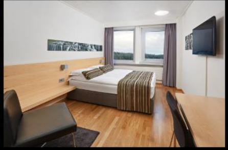
***รูปภาพเพื่อประกอบการโฆษณาเท่านั้น***