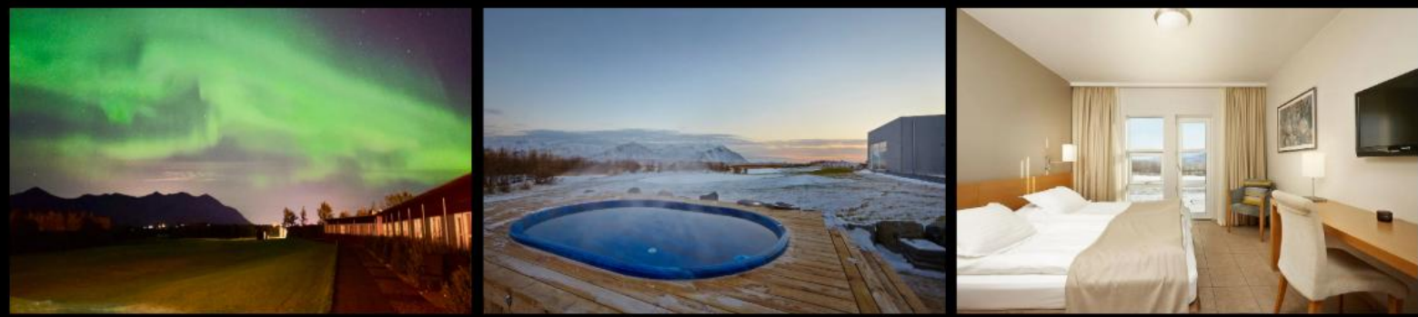
***รูปภาพเพื่อประกอบการโฆษณาเท่านั้น***