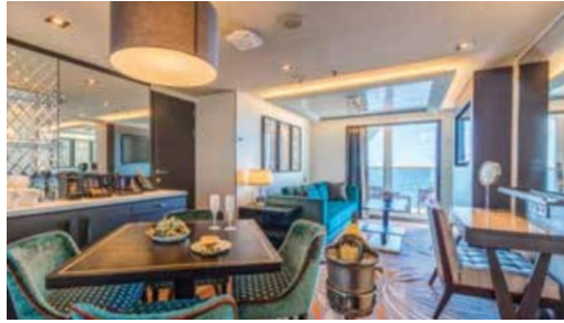
Deluxe Premium Suite