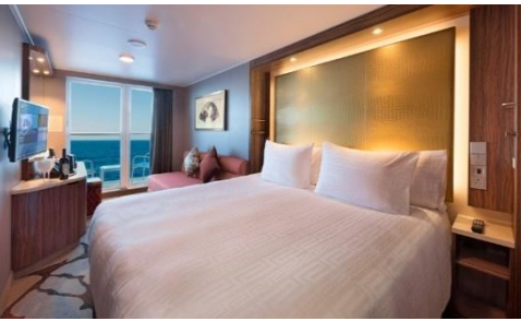
Balcony / Balcony Deluxe Stateroom