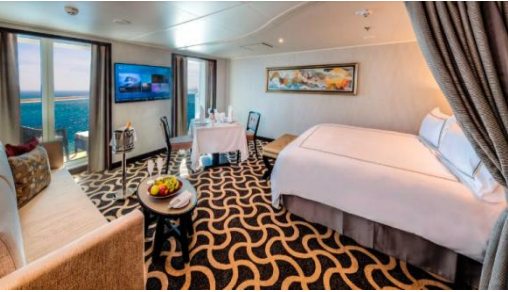
Palace Deluxe Suite