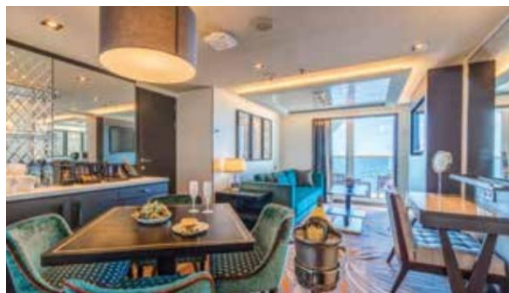
Deluxe Premium Suite