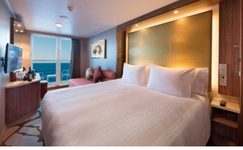
Balcony / Balcony Deluxe Stateroom