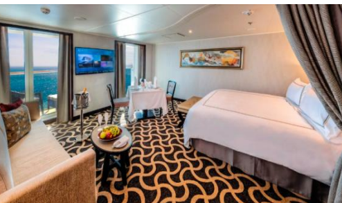
Palace Deluxe Suite