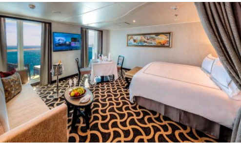
Palace Deluxe Suite