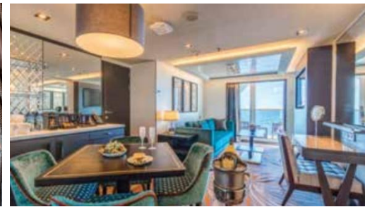
Deluxe Premium Suite