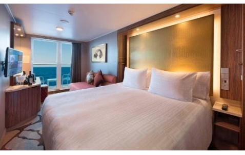
Balcony / Balcony Deluxe Stateroom