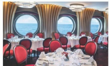
Il Cilegio Restaurant (ชั้น 6)