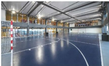
Sportplex (ชั้น 16)