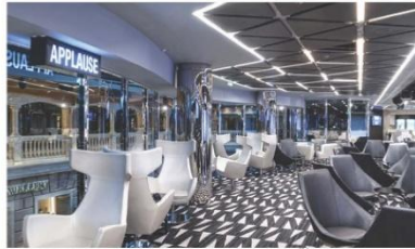
TV Studio & Bar (ชั้น 7)