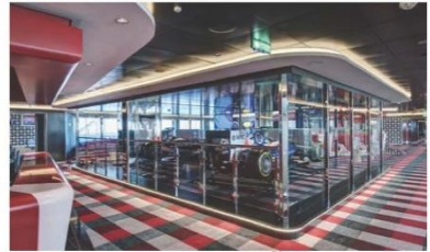
F1 Simulator (ชั้น 16)