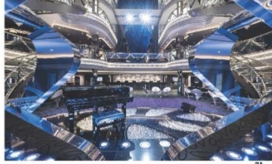
Infinity Atrium & Reception (ชั้น 5)