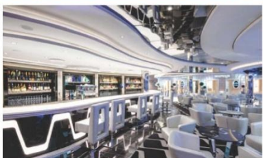
Bellissima Bar & Lounge (ชั้น 6)