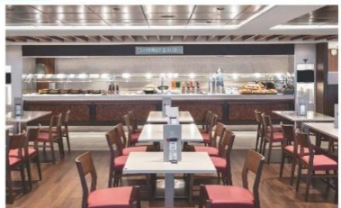
Marketplace Buffet (ชั้น 15)