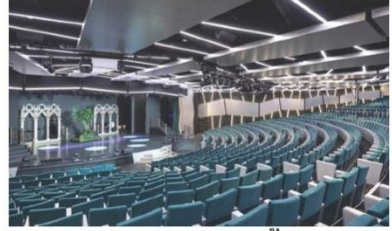
London Theatre (ชั้น 5-6)