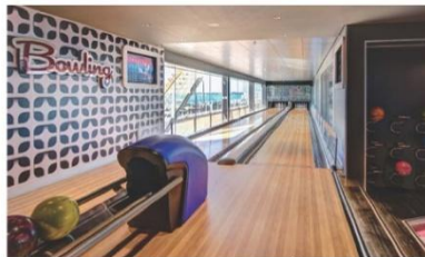
Bowling Alley (ชั้น 16)