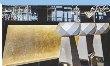
Champagne Bar (ชั้น 7)