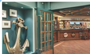
Masters of the Sea (ชั้น 7)