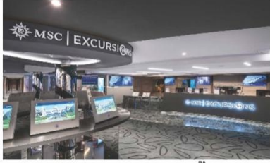
MSC Excursions (ชั้น 5)