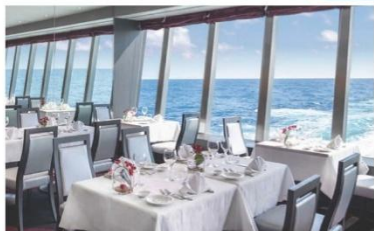
Lighthouse Restaurant (ชั้น 6)