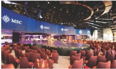
Carousel Lounge (ชั้น 7)