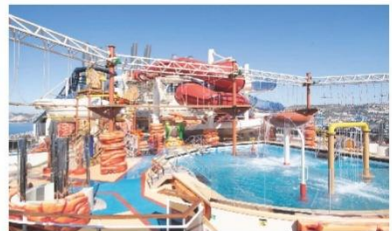
Arizona Aquapark (ชั้น 19)