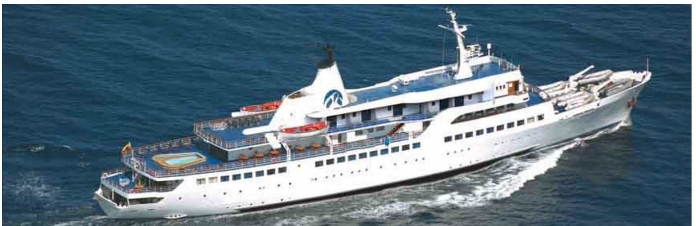
รองรับผู้โดยสารได้ 100 คน, Deluxe, fully air conditioned Galapagos cruise ship