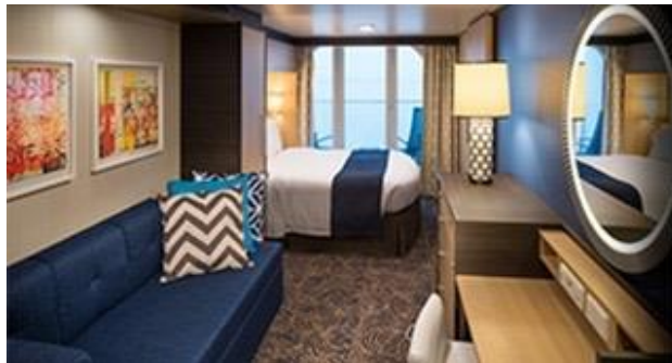
ขนาดห้องพัก : 198 ตารางฟุต ขนาดระเบียง: 55 ตารางฟุต