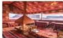
นอนแคมป์

** พักที่ Zawaydeh Camp 4* Hotel หรือเทียบเท่า **