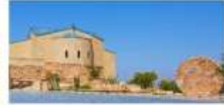
The Moses Memorial Church