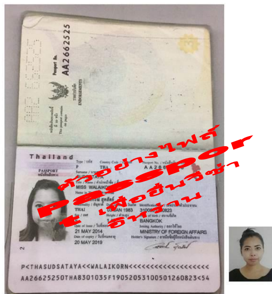
ตัวอย่าง File สำหรับ Scan หน้า Passport เพื่อยื่นวีซ่าอิหร่าน

* สำคัญมาก กรุณาแจ้งเบอร์ที่ถูกต้องที่สามารถติดต่อท่านได้โดยสะดวก เนื่องจากทางสถานทูตจะมีการโทรเช็คข้อมูลโดยตรงกับท่าน *