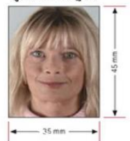
รูปถ่ายมาตรฐาน

หลักฐานการทำงาน (ภาษาอังกฤษและเป็นหลักฐานปัจจุบันเท่านั้น)