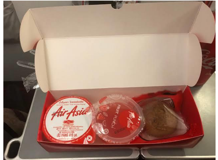
(ภาพตัวอย่าง)

มีบริการ Snack Box บนเครื่อง ทั้งขาไปและขากลับ