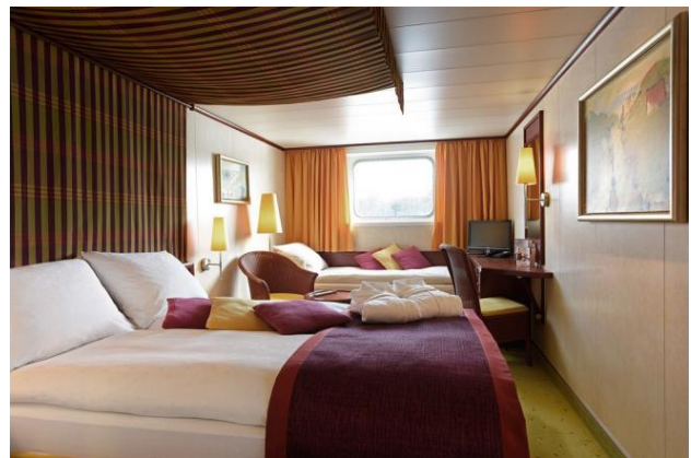
2 bed outside cabin with extra bed , deck 1 cabin A