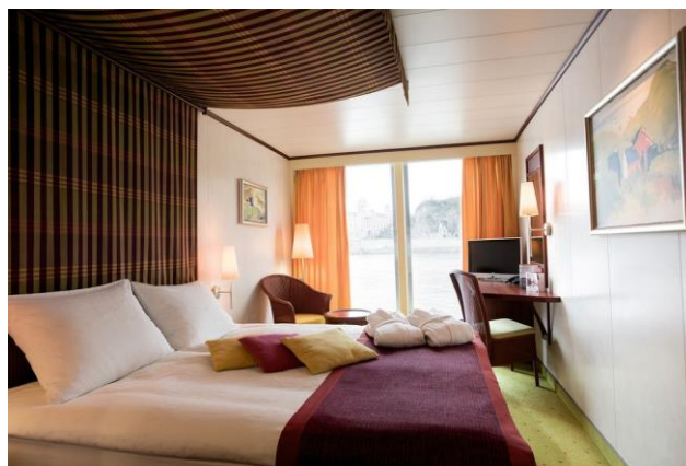
2 bed outside cabin with panorama window , deck 3 cabin B