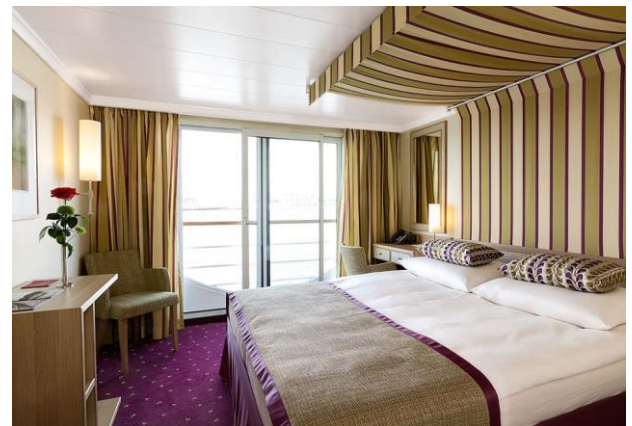
2 bed outside cabin with juliette balcony, deck 2 cabin C