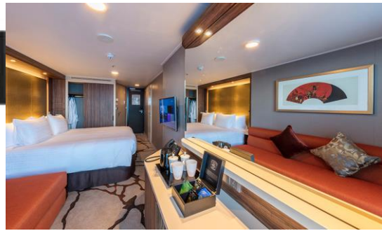
BALCONY DELUXE STATEROOM ห้องระเบียงดีลักซ์