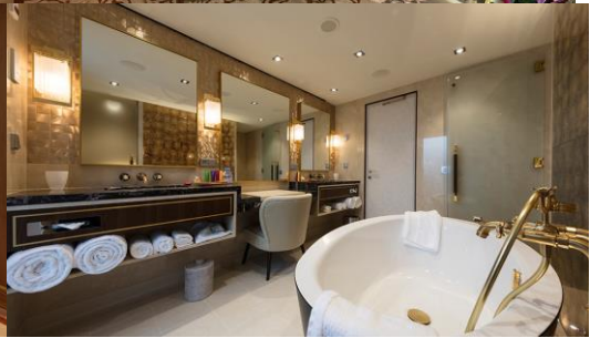
PALACE VILLA ห้องสวีทวิลล่า