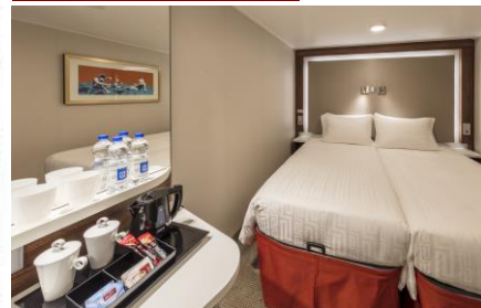
ห้องไม่มีหน้าต่าง INTERIOR STATEROOM