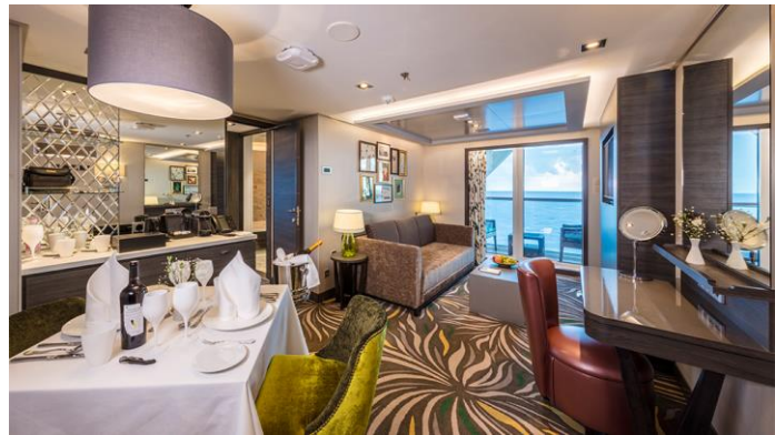
PALACE PENTHOUSE ห้องสวีทเพ้นเฮ้าท์