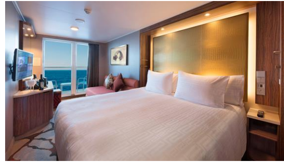
BALCONY STATEROOM ห้องมีระเบียง