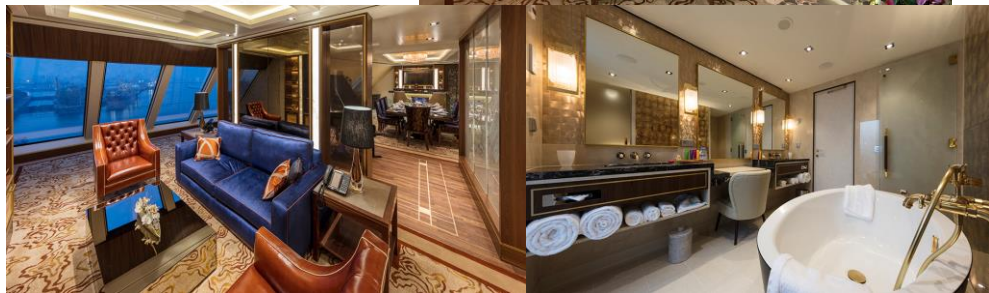
PALACE VILLA ห้องสวีทวิลล่า

อัตราค่าบริการ ต่อท่าน (งดแถมกระเป๋า) วันที่ 11-13 ธ.ค. 62