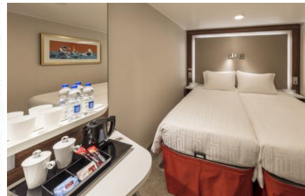
ห้องไม่มีหน้าต่าง INTERIOR STATEROOM