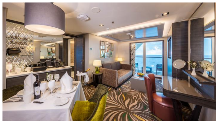
PALACE PENTHOUSE ห้องสวีทเพ้นเฮ้าท์