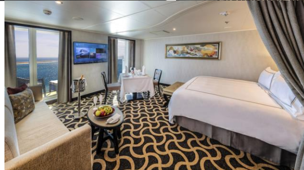
PALACE SUITE / DELUXE ห้องแบบสวีท