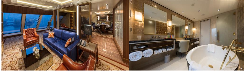
PALACE VILLA ห้องสวีทวิลล่า