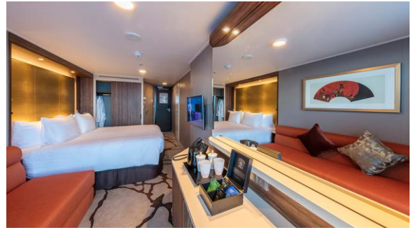
BALCONY DELUXE STATEROOM ห้องระเบียงดีลักซ์