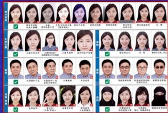
รูปตัวอย่าง