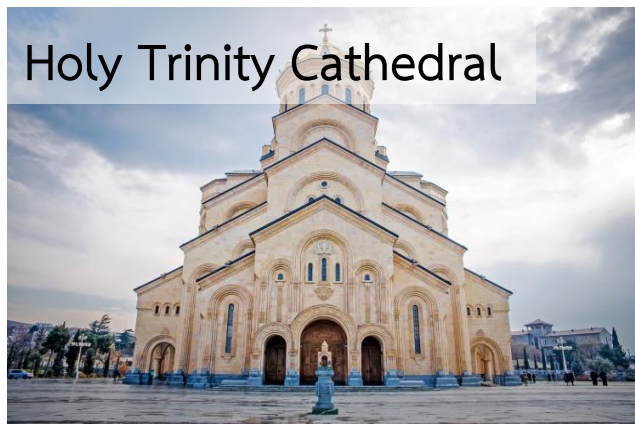
Holy Trinity Cathedral

จากนั้นนำท่านชม โบสถ์เซนต์ทรีนิตี้ (Holy Trinity Cathedral) วิหารศักดิ์สิทธิ์ของทบิลีซีที่เรียกกันว่า Sameba เป็นโบสถ์หลักของคริสตจักรออร์ทอดอกซ์เจียตั้งอยู่ในทบิลีซีเมืองหลวงของจอร์เจีย สร้างขึ้นระหว่างปี 1995 ถึง ปี 2004 และเป็นวิหารที่สูงที่สุด อันดับที่ 3 ของโบสถ์ออร์ทอดอกซ์ทั่วโลก