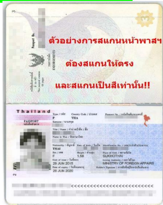
พาสปอร์ตต้องถ่ายให้ติดทั้ง 2 หน้า แบบตัวอย่าง

หมายเหตุ กรุณาแจ้งความประสงค์อื่นตามที่ท่านต้องการ อาทิเช่น