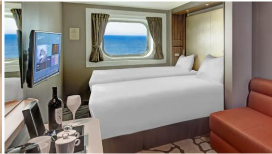
ห้องหน้าต่างมีหน้าต่าง