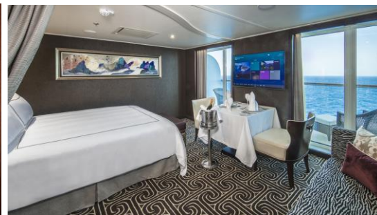
ห้องสวีท

อัตราค่าบริการ ต่อท่าน (งดแลมกระเป่า) วันที่ 30ต.ค.-1พ.ย. 62