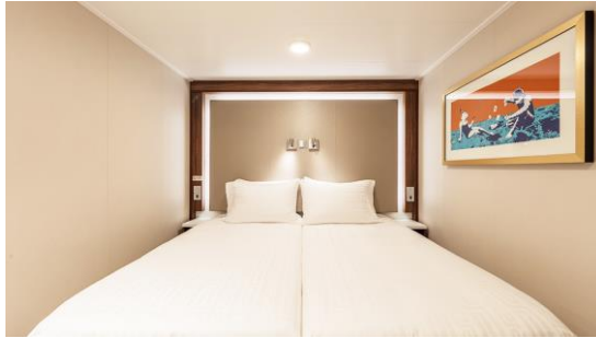
ห้องหน้าต่างไม่มีหน้าต่าง