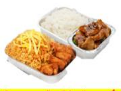
บริการอาหารร้อน ไข่-กลับ บนเครื่อง *** เนื่องจากเป็นเที่ยวบิน จึงไม่สามารถควบคุมอาหารได้ ***