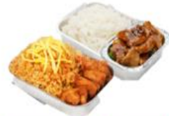
บริการอาหารร้อน ไป-กลับ บนเครื่อง

** เนื่องจากเป็นเที่ยวบิน จึงไม่สามารถโหลดกระเป๋าได้ **