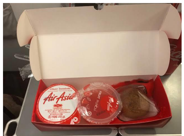
(ภาพตัวอย่าง)