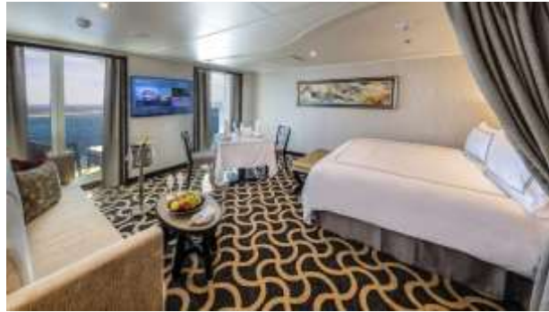
PALACE SUITE / DELUXE ห้องแบบสวีท