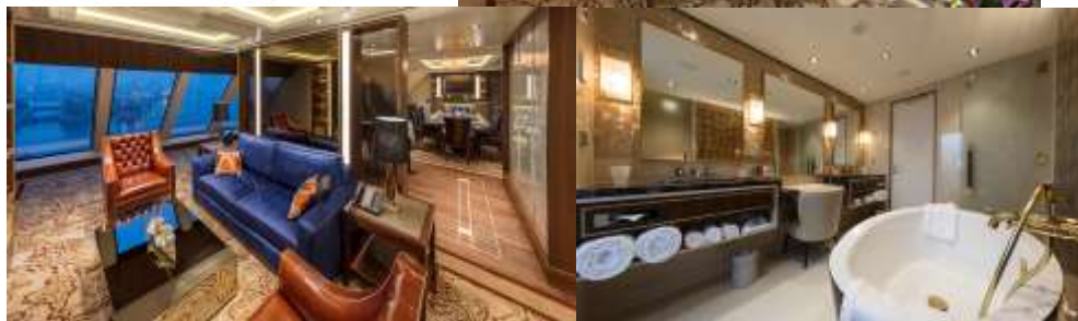
PALACE VILLA ห้องสวีทวิลล่า