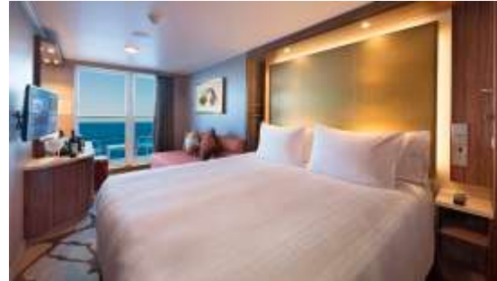
BALCONY STATEROOM ห้องมีระเบียง