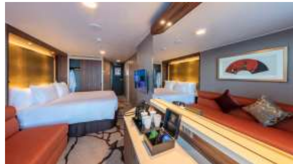
BALCONY DELUXE STATEROOM ห้องระเบียงดีลักซ์