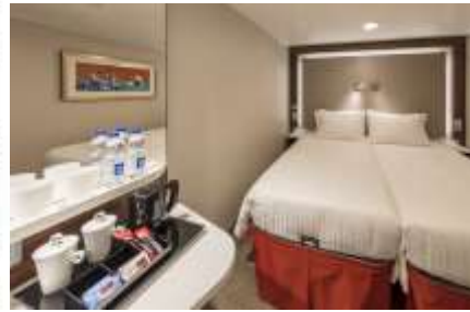
ห้องไม่มีหน้าต่าง INTERIOR STATEROOM