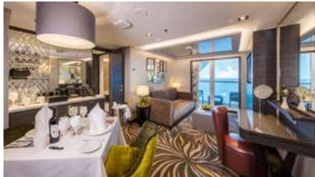
PALACE PENTHOUSE ห้องสวีทเพ้นเฮ้าท์