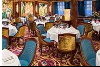
Deck 06 - Public Rooms