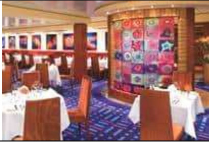
Deck 06 - Public Rooms